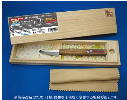
※製品改良のため、仕様・価格を予告なく変更する場合があります。